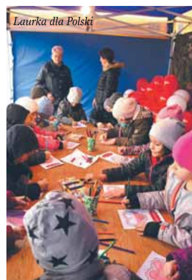
Laurka dla Polski