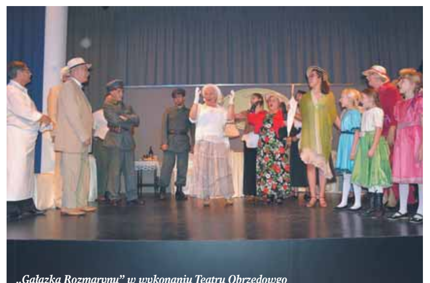
„Gałązka Rozmarynu” w wykonaniu Teatru Obrzędowego