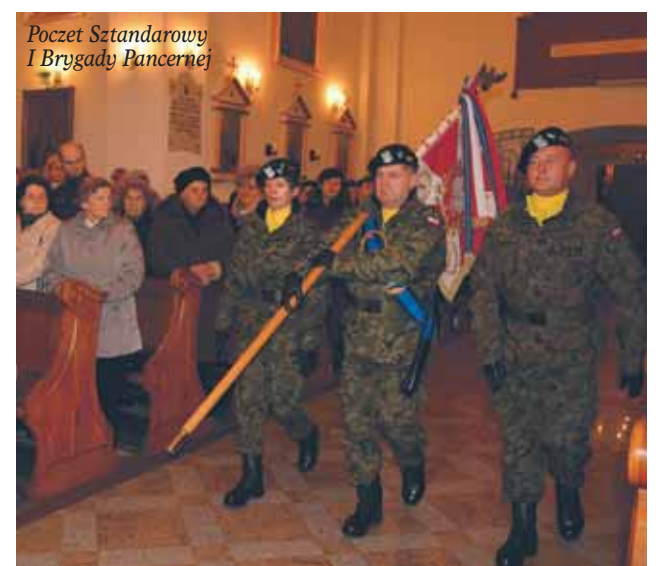
Poczet Sztandarowy I Brygady Pancerniej