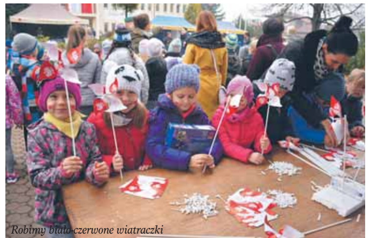
Robimy biało-czerwone wiatraczki