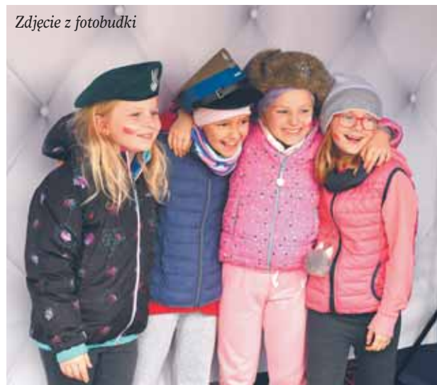
Zdjęcie z fotobudki