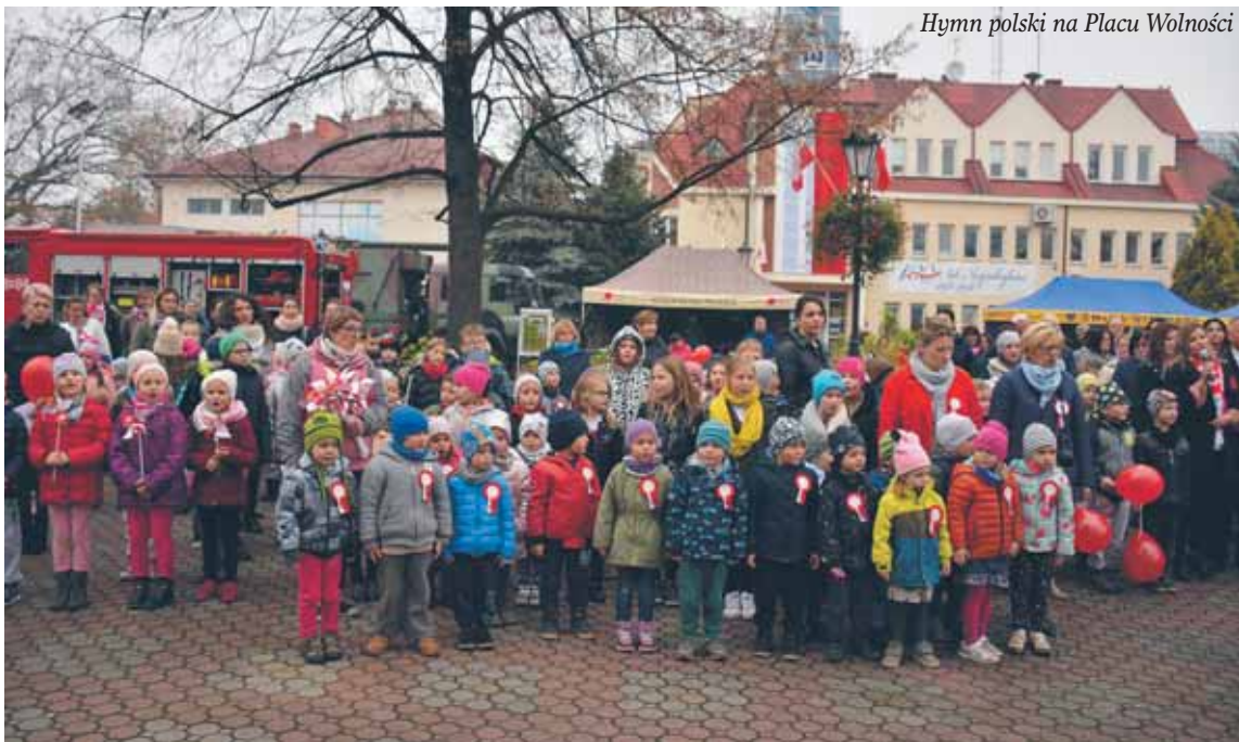
Hymn polski na Placu Wolności