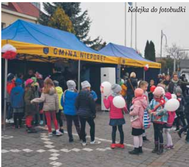
Kolejka do fotobudki