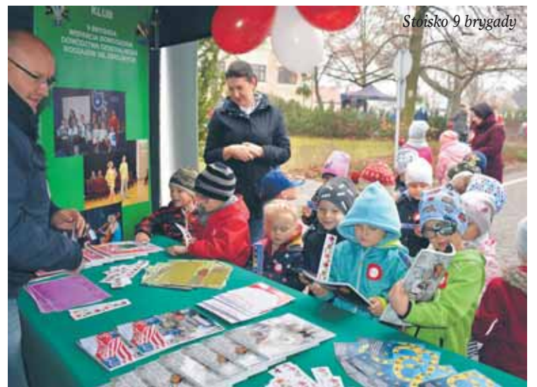
Stoisko 9 brygady